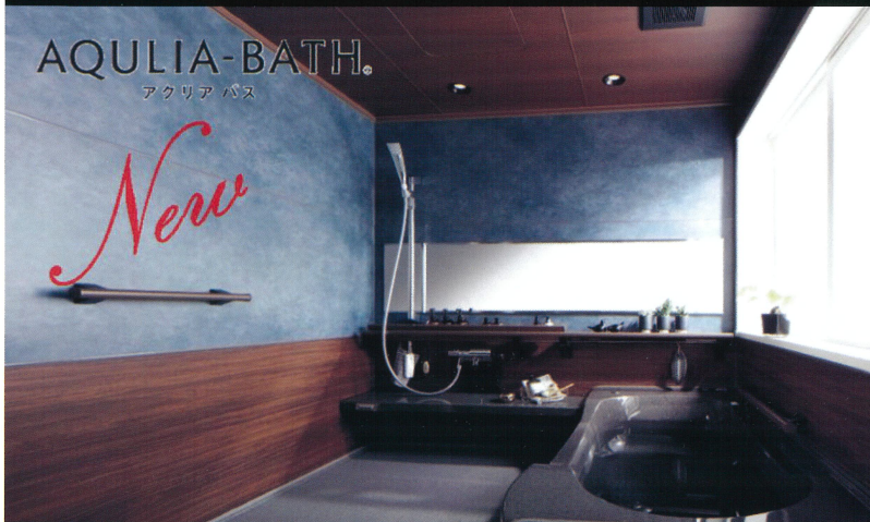
■アクリアバス新色提案 (腰壁カラー)