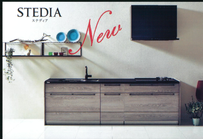
■ブラックカラーアイテムが更に充実