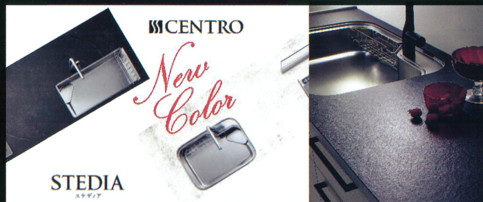
■CENTRO/STEDIA セラミックワークトップ新柄登場